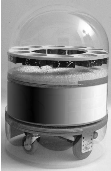
Aitu, kurz vor der Fertigstellung der Hülle

Aitu macht die Intensität der elektromagnetischen Strahlen im hochfrequenten Bereich (so auch der Handystrahlen) mittels Geräuschen hörbar und ein «Schneesturm» von Styroporkügelchen visualisiert die aufzuwirbelnden Fakten in der vielerlei unter den Tisch gekehrten Strahlenthematik. Bei den Geräuschen wurde bewusst auf natürliche Töne gesetzt, damit die HörerInnen bei dem Vergleich der Werteskala auf ihren Erfahrungshorizont zurückgreifen können. Im Beispiel Regen tröpfelt es bei schwacher Strahlenbelastung fein und beinahe lieblich, bei starker stürmt und gewittert es.